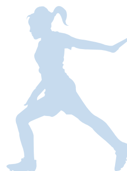
Tabela 2 prikazuje podatke o finančnih sredstvih, ki jih je Občina Tržič namenila področju športa v obdobju od leta 2019 do leta 2022.

Občina Tržič preko javnega razpisa letno sofinancira v povprečju 20 izvajalcev letnega programa športa, ki nudijo več kot 160 različnih programov (od rekreacije do kakovostnega športa). Na področju športne rekreacije je potrebno povečati in izboljšati ponudbo športnorekreativnih programov, kar bi pomenilo še večje vključevanje različne populacije v šport.