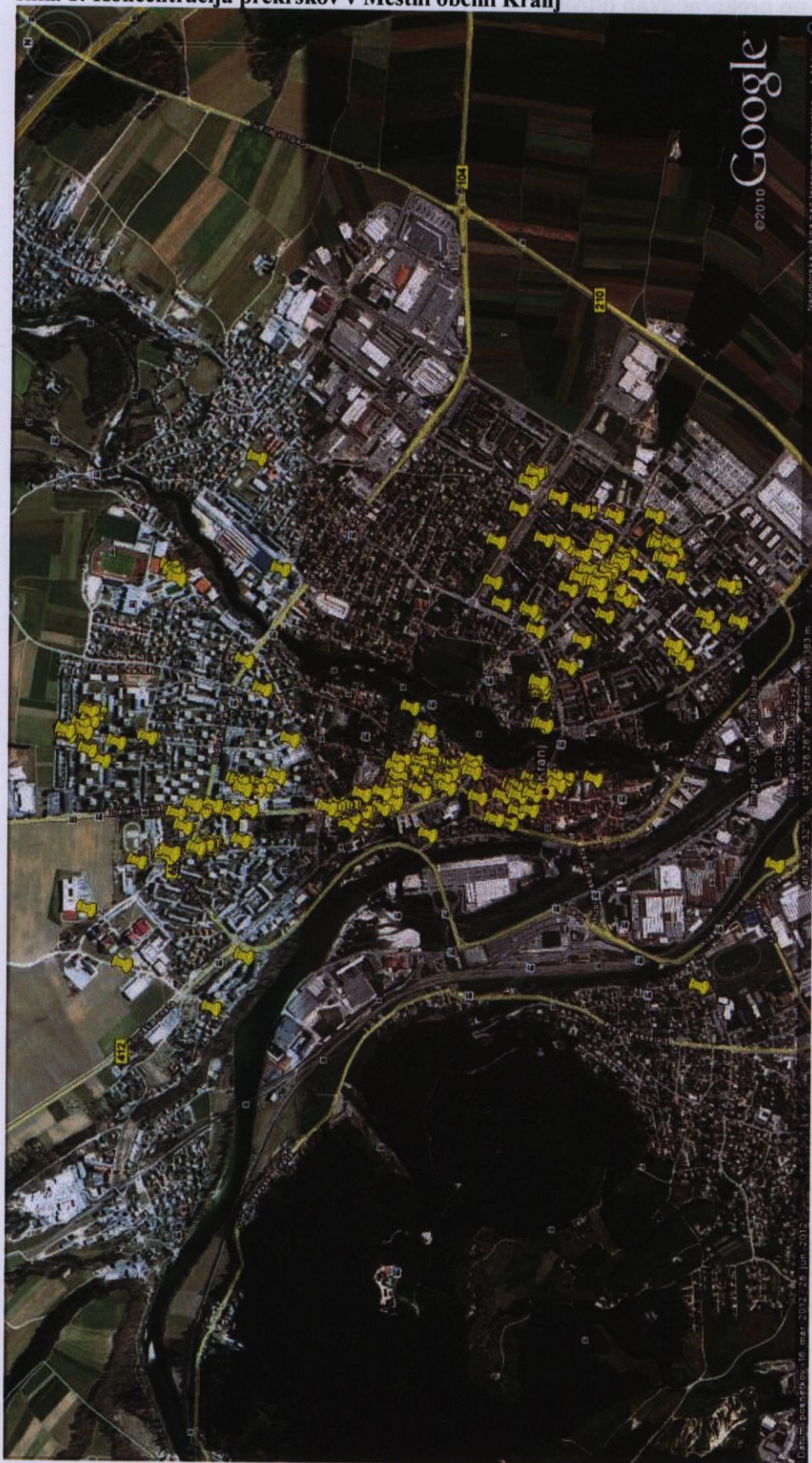
Slika prikazuje koncentracijo prekrškov, brez prekrškov iz področja prekoračitve hitrosti.