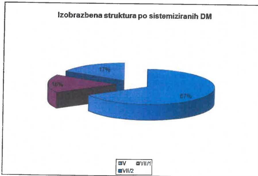
Graf št. 2: Izobrazbena struktura zaposlenih po sistemiziranih delovnih mestih