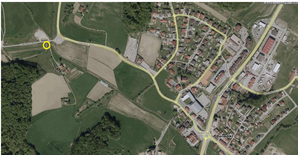
Slika 3: Pregledna situacija na DOF, območje v rumeni barvi

V ureditvenem območju osnutka sprememb in dopolnitev OPPN se v naravi nahaja nepozidano zemljišče.