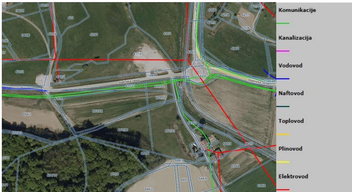
Slika 5: Pregledna situacija na DOF z obstoječimi komunalnimi vodi