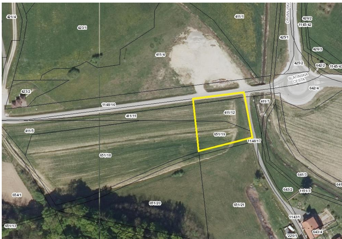
Slika 4: Pregledna situacija na DOF z obstoječim parcelnim stanjem, območje v rumeni barvi