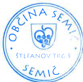
Polona Kambič, županja