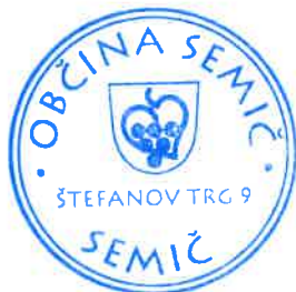
Polona Kambič, županja