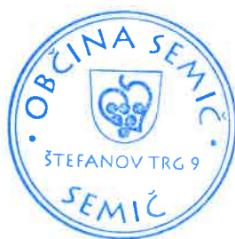
Polona Kambič, županja

Številka: 410-09/2017-56 Datum: 1. 6. 2018