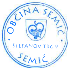
Polona Kambič, županja

Številka: 410-09/2017-44 Datum: 16. 4. 2018