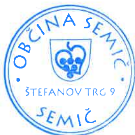
Polona Kambič, županja

Številka: 410-09/2017-36 Datum: 14. 3. 2018