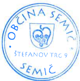
Polona Kambič, županja

Številka: 410-09/2017-37 Datum: 14. 3. 2018