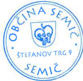
Polona Kambič, županja

Številka: 410-09/2017-51 Datum: 24. 5. 2018