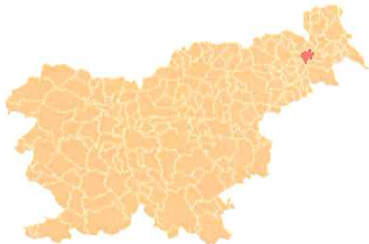
Slika 2: Lega Občine Sveti Jurij ob Ščavnici v Republiki Sloveniji