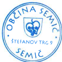
Polona Kambič, županja

Številka: 410-10/2016-59 Datum: 28. 11. 2017