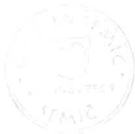
Polona Kambič, županja

Številka: 410-10/2016-53 Datum: 24. 10. 2017