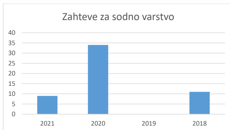
Preglednica 4: Zahteve za sodno varstvo