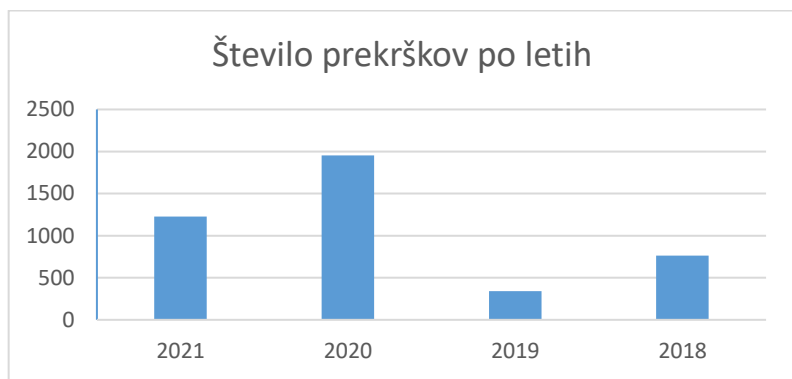
Preglednica 1: Število prekrškov po letih